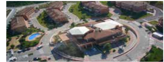
Urb. Alfa del PI - Alicante