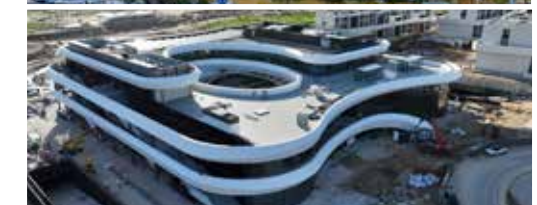
LaFinca Grand Café - Centro Comercial (Pozuelo)