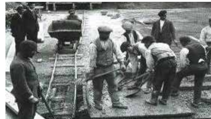
BANCO DE ESPAÑA, MURCIA 1926

Construcciones San Martín, S.A. tiene actualmente en plantilla más de 100 trabajadores entre sus dos delegaciones: Pamplona y Madrid, aparte del personal eventual de obra y oficinas.