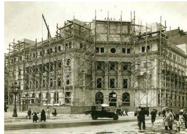
Banco de España, Gran Vía Layetana. Barcelona

La interacción de las anteriormente descritas competencias ha supuesto que miles de promotores hayan confiado a Construcciones San Martín, S.A. el desarrollo y ejecución de sus proyectos.