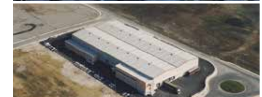
Nave Industrial S.A.S