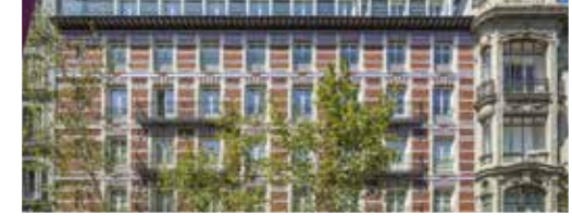
7 Viv. Calle Serrano 7 - Madrid

Parking Robotizado: Especialización en parking robotizados, obra civil y estructura de los mismos.