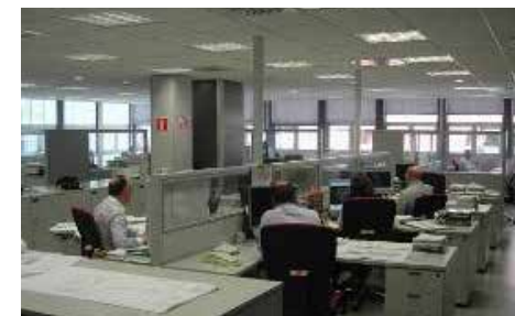
Oficinas Construcciones San Martín Madrid

Las oficinas de Madrid están ubicadas en la calle Orense nº 11 - 3ª planta, con una superficie útil aproximada de 800 m². En ella se encuentran las áreas de Dirección, Administración y Personal, Aseguramiento de la Calidad Medio Ambiente y Seguridad y Salud, Departamento Técnico e Instalaciones, Compras, Estudios y Reprografía.