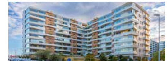
108 Viv. Edificio Zafiro - Pamplona

Industrial: Ejecución de naves, fábricas y plantas industriales, grandes almacenes industriales de todo tipo y tamaño, encargándonos cuando ha sido preciso del Proyecto completo con nuestro Departamento Técnico con los Projectistas y Directores Facultativos.